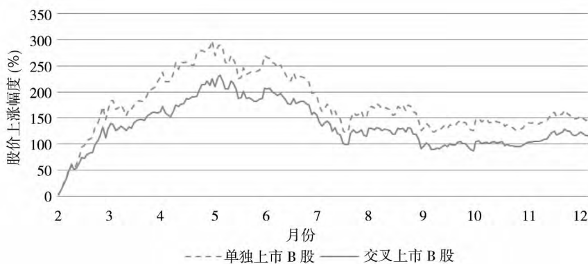
图3 B股向A股投资者开放的市场反应

应分析的结果.横坐标表示月份.由于B股市场开放的消息之前基本上未被市场察觉,所以B股在2001年2月19日之前并未出现异常情形.图3没有显示2001年2月19日之前的情形.在2001年2月19日证监会发布公告的当天下午,B股市场开始上涨,当日涨幅在3%左右,因此将2001年2月19日包含在了分析窗口期内.图3显示,自2001年2月19日以来,B股市场累计上涨超过200%,直至2001年5月底、6月初达到最高点,这与吴文峰等 [24] 的发现是一致的.