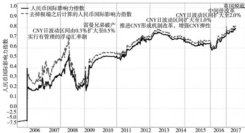
图 A2 人民币国际影响力指数(分别用全样本和去掉极端值的样本计算) 走势图