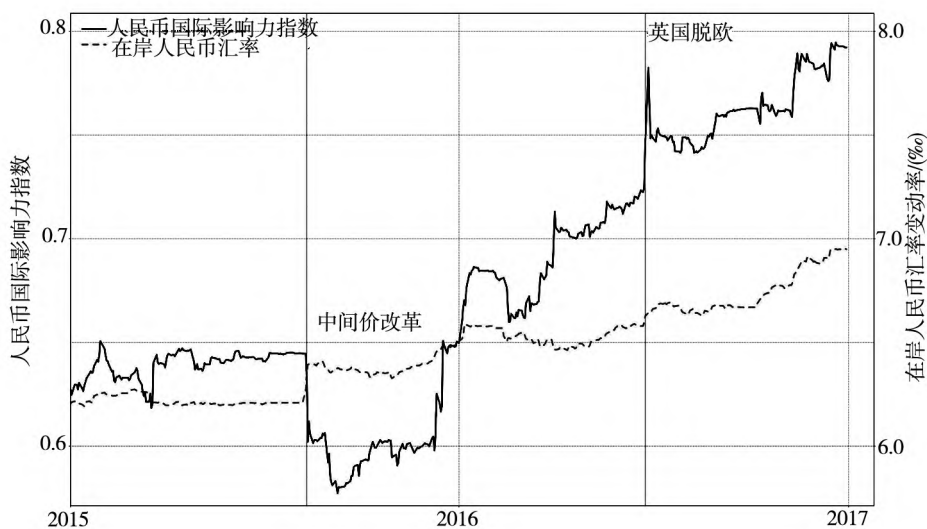
图 2 人民币国际影响力指数及人民币汇率走势图